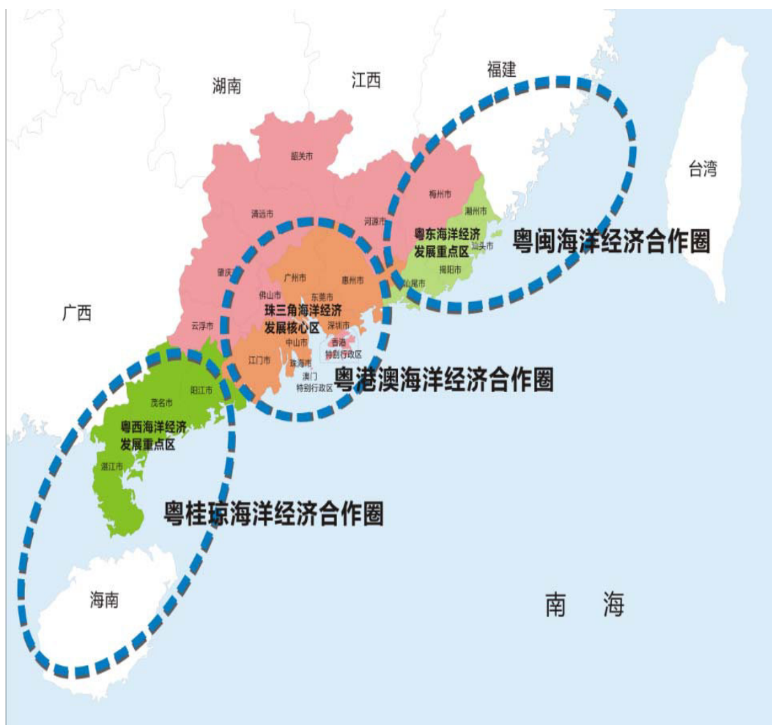
图 3-2 广东省海洋经济“三区三圈”布局图